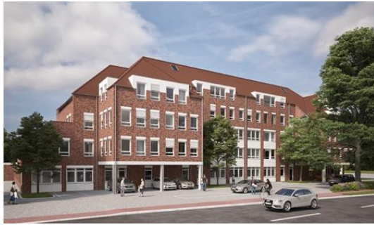
In diesem Haus an der Hammer Straße in Münster entstehen derzeit 25 neue Wohnungen. Sicher dürften sie sein, denn den Großteil des Gebäudes nutzt die Polizei.